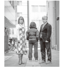
夢を語る高校3年生はまぶしかった。