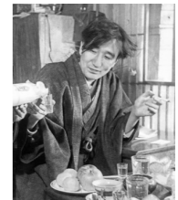
写真全体は23ページに掲載。

東京・三鷹の自宅で俳優関千 恵子のインタビューを受ける太宰 治。関は小説『パンドラの匣』 (1946年)が原作の大映映画 『看護婦の日記』(47年公開)で デビュー。太宰は関から手土産の 一升瓶で日本酒を注いでもらい 笑顔を見せた。48年2月9日。